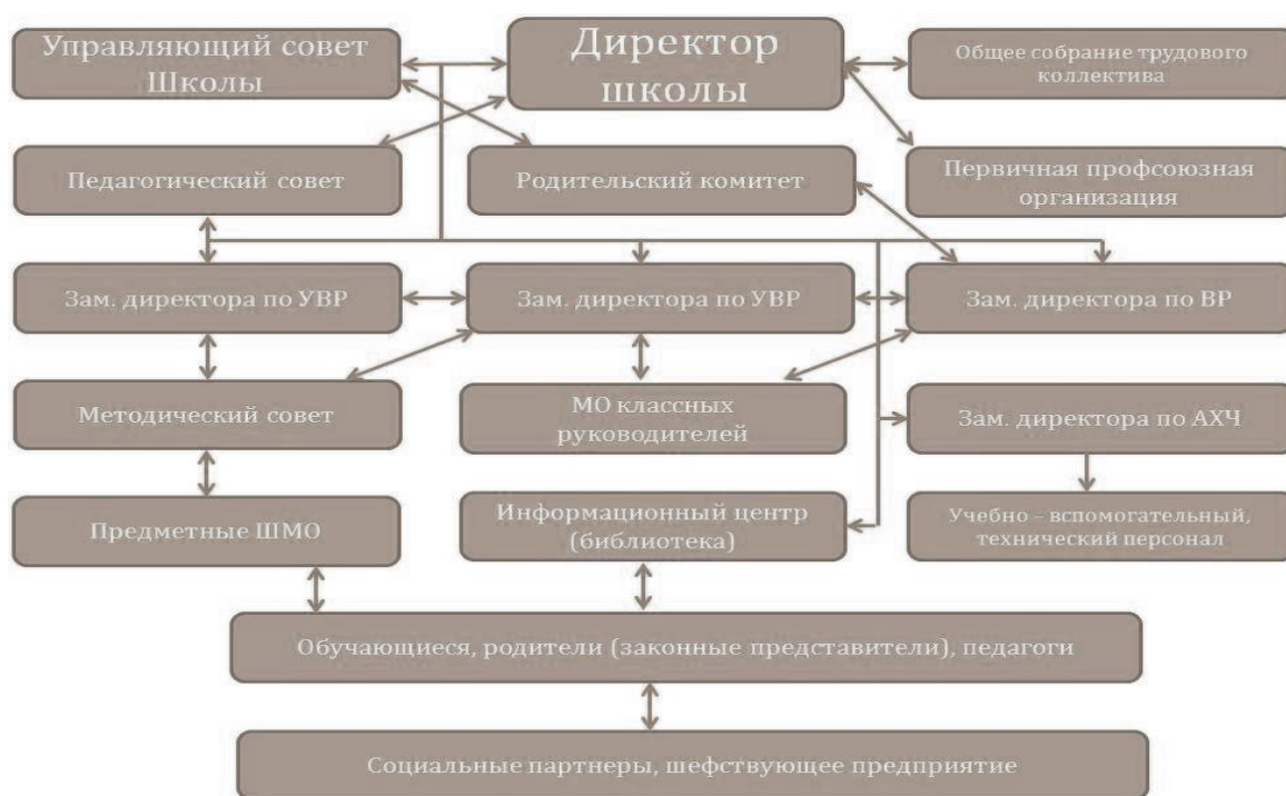
Рисунок 2. Система управления в ОО