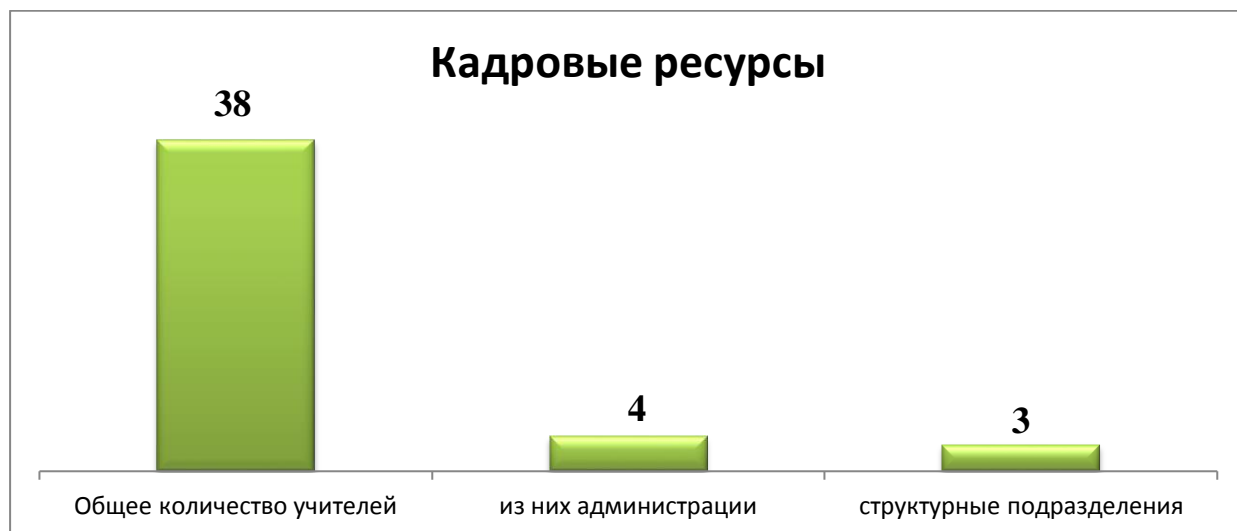
Рисунок 3. Кадровые ресурсы

Повышение квалификации педагогов проходит через систему курсовой подготовки на базе учреждений: ГАОУ ДПО СО «ИРО» (г. Екатеринбург, г. Нижний Тагил), НИЯУ МИФИ (г. Лесной), через систему дистанционных курсов, участие в конкурсах, семинарах различного уровня, научно-практических конференциях, обобщение опыта на методических объединениях и в сети Интернет и т.д.