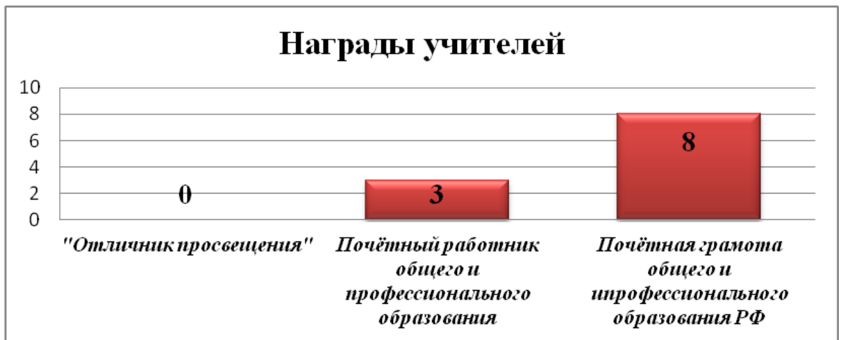
Рисунок 4. Награды учителей