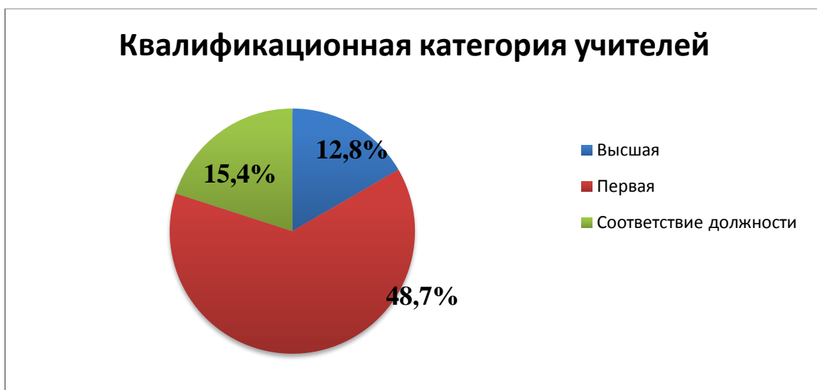
Рисунок 7. Квалификационная категория учителей